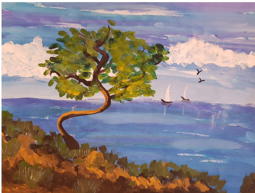
Токмачёва Настя, 3б