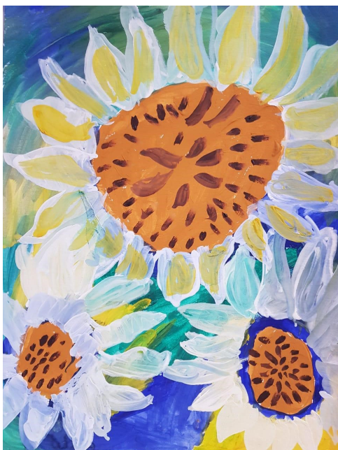
Токмачёва Настя, 3б

Лето – это самая прекрасная пора! Можно забыть об учебниках и поехать путешествовать.