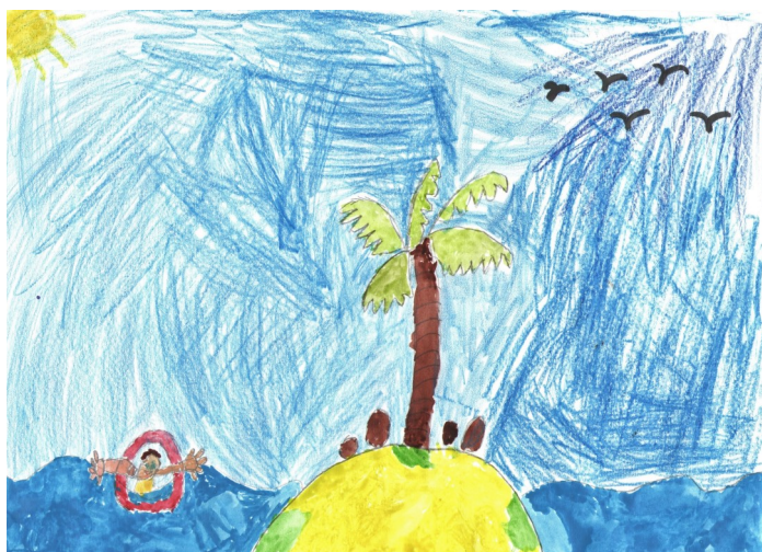
Дима Рассохин, 26