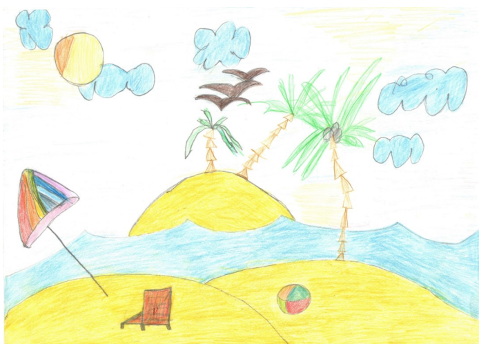
Матвей Крутиков, 16