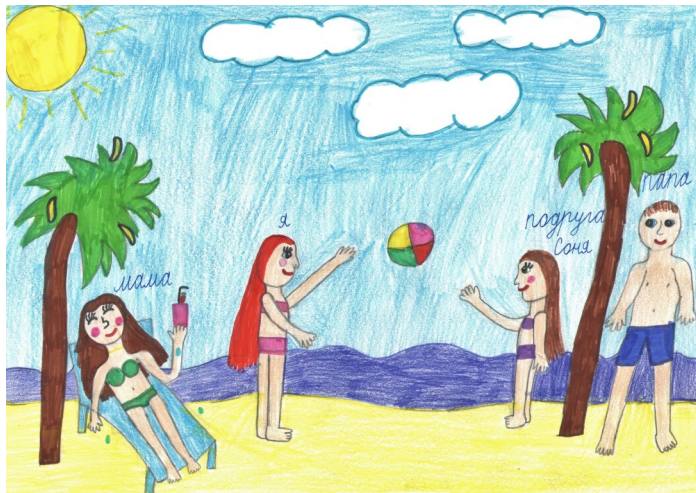
Софья Бабушкина, 16