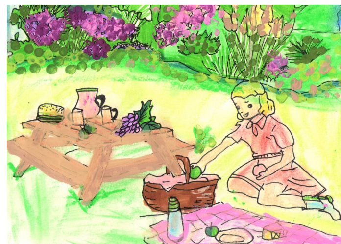
София Антосина, 26