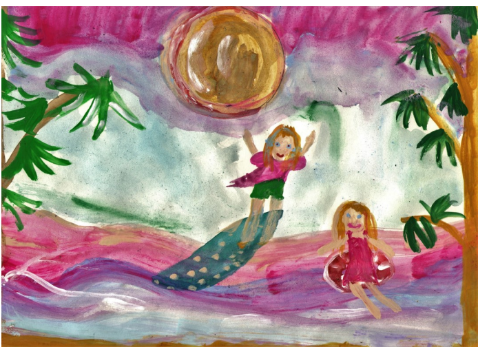
София Антосина, 26